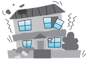
地震・噴火を原因とする 損壊・埋没