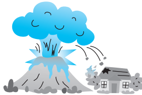
地震・噴火を原因とする 火災