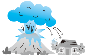
地震・噴火を原因とする 火災