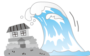
地震による津波を原因とする 流失

裏面の見積依頼書にご記入いただき、FAX等でご提出ください。 最適なご契約プランをおすすめさせていただきます。