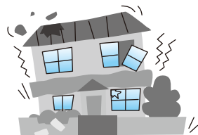
地震・噴火を原因とする 損壊・埋没